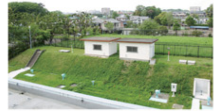
浄水公園 P06/MAP・1 谷保浄水所の北側にある、通称タイヤ公園。周囲より一段高くなっているのは、この真下に最大約6000m 3 の水が貯められる配水池があるからだ。地域の安心安全のための強い味方がここに。