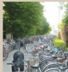
▲中央線から鉄道総研への引込み線の跡地は、レールは撤去され、公共の自転車置き場などとして活用されている。ゆるやかなカーブに名残を感じる。