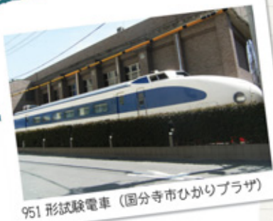
951 形試験電車 (国分寺市ひかりプラザ)