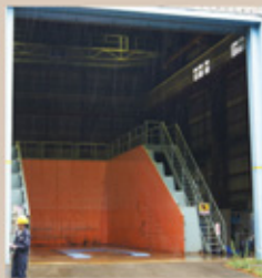
▲大型降雨実験施設。6万坪にもなる広大な敷地内には、このような巨大な施設も含め約20の実験棟が立つ。