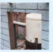
▲家の敷地の内外に井戸水だけで7カ所もの蛇口がある。(上)ポンプは囲いの中に。個人宅の浅井戸は約2~30メートルの深さ。(下)