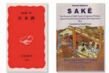
「日本酒」(秋山裕一著 岩波新書) 720円+税 「SAKE」4,500円+税

左: 造り酒屋に生まれ、醸造にこだわり続けた著者(国立市在住)による日本酒専門書。伝統的な製造過程から近代化の背景、味の見極め方や、こだわりの楽しみ方までじっくり日本酒に没れる一冊。 右: 「日本酒」の英語訳版。海外で日本酒を取り扱っている方や日本酒への興味をもたれた方々へ向けた「SAKE」のもっと不思議な魅力を伝え、酒造りの疑問に答える翻訳版です。