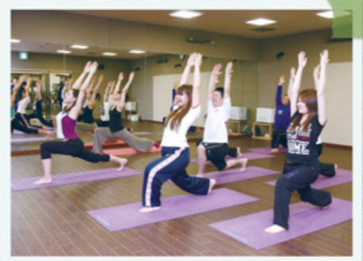
インストラクターにあわせて楽しく体を動かして、驚きのデトックス効果!

せっかくのフィットネス通い、カラダの内側からキレイにしたい! って人にお勧めなのがHOT STUDIO。 室温38℃、湿度65%というホットな環境でのエクササイズ。国立ではココだけのスペシャルな空間なんです。 おてかけの帰り道に少しの時間で気軽に参加できるエクササイズ。自分でも驚くほどの汗をかいてしっかり効果を感じられるはず!