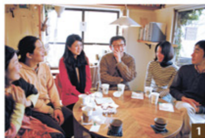
1. 寺林邸にて。思い出話に花が咲く。「住むことを十分楽しませてくれました」。2. ウッドデッキの欄は通りを歩く人への掲示板にも。3. 住人同士のコミュニケーションに役立った猫のひじき。4.5. 関田邸。押し入れを改装してギャラリースペースに。