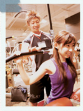
マシンの効果から使い方をマスターしてレクチャーします。

暮らしの基礎にまずはカラダ作りはしたいけど、ジムでトレーニング! ってガチガチに鍛えるイメージでちょっと...。というのはカン違い。 GEOフィットネス 国立店ではカラダの専門家が目的に合わせて、最も効率のよいあなた専用のトレーニングプランを作ってくれる。 仕事あがりのメタボ対策も、買いもの途中の④ダイエットも、これなら続けられるかも。