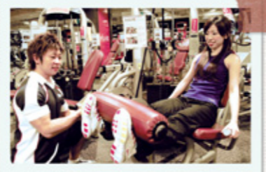
目的にあわせたトレーニング方法を伝授! あなただけのプランでしっかり効果。