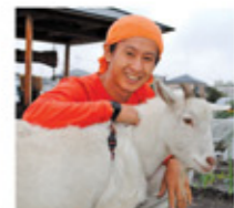
(右) 国立BBQファームを運営する国立ファームは、市内唯一の農業生産法人。レストラン「農家の台所」(写真)も運営するほか、「山形ガールズ農場」や「ソルトリーフ農場」、卸売りなど幅広く農業に参入している。本社は国立駅近く中一丁目のオフィスビルにある。

(農夫twitter→ kf_onoatsushi) ●農家の台所 くにたちふぁーむ 国立本店 国立市東1-16-17 ポポロビル南館3階 年末年始(今年3月より月曜日もOPEN) TEL:042-571-4831 P06/MAP・4 3月18日には立川高島屋のB1に「農家の台所そうざい」をOPEN予定。