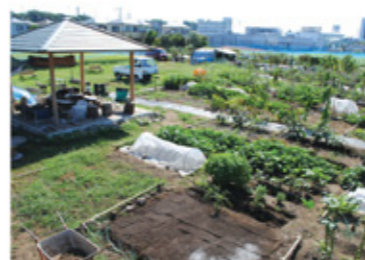
(上) 谷保の国立・府中ICすぐの荒地を、一年かけて石を拾って畑にした。昨年3月にオープンしてすぐにフル稼働。都心の高級ホテルに住んでいる人や芸能人も利用する。ロンドンブーツの淳さんがここで野菜作りをしているのは有名。P06/MAP・5