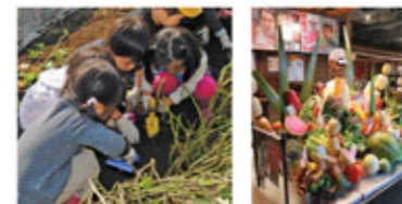
(左) みんなでイモ掘り。採りたての野菜を食べて、野菜が好きになる子どもも少なくないそう。