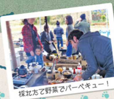
採れ方野菜でパーベキュー!