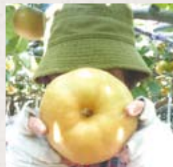
夏には人の顔と同じくらい巨大な梨が実る。梨園ボランティアのホームページはhttp://www13.plala.or.jp/knv/

ア]では、花粉つけの短期ボランティアを募集中。報酬もなく、お弁当も自前。それでも、きちんと手入れされた梨棚での農作業には、人を惹きつける魅力がある。申し込みは電話042-574-8570(平塚事務局長)、またはメールknv@kusanone.jpまで。