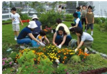
(上) PTAのお母さんたちも草花の世話に通ってくる。 (右上) 野菜は無農薬だから虫もたくさん寄ってくる。毎日せっせと手で取り除く。屋上庭園は、虫にも鳥たちにも楽園なのだ。 (右下) 熟したトマトを収穫。「おいしそう〜」